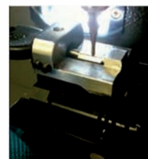
ADATTATORE CHIAVE FORD